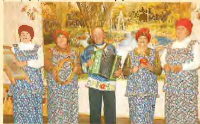
Фольклорный ансамбль "Родник" с. Гуселетово

переселенцев Романовского района, а также традиционный фольклор русских старожилов и переселенцев Алтая..