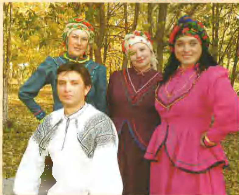
Фольклорный ансамбль "Хмельюшка" с. Романово

Фольклорный ансамбль "Хмельюшка" создан в 2000 году из выпускников специализации "Фольклор и этнография" АККК. Руководитель - Юрий Янковский. В репертуаре коллектива песни украинских