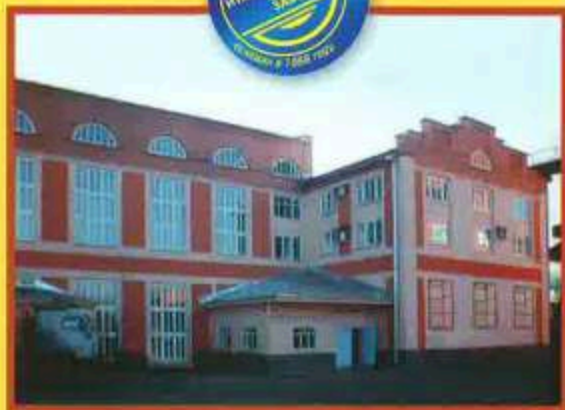
Россия, 659418, Алтайский край, Зональный район, с. Соколово, ул. Кирова, 1, тел.: (385-30) 263-80

Иткульский спиртзавод – старейшее на Алтае и в Западной Сибири предприятие, основанное в 1868 году, сочетающее вековые традиции русского спиртового дела с новейшими современными технологиями производства.